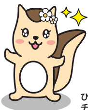
ひろがりす チークちゃん

12年前に《ひろがり》に加入しました。予定利率で確実に運用されているので計画的に将来のための資金を準備できるところがいいですね。その時の収入に応じていつでも毎月の掛金を変更できるので無理なく続けることができます。積立金の一部払出は何度か利用していますが、以前、引っ越しの際に家財の購入費用に充てられたので大変助かりました。